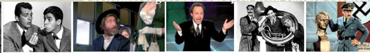
Da sinistra: Billy Wilder; Jerry Lewis e Dean Martin; Gene Wilder; Billy Crystal; i Fratelli Marx; Mel Brooks