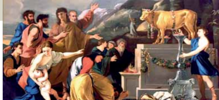
Un'opera di Nicholas Poussin, 1629: L'adorazione del vitello d'oro.

Un'opera di Rembrandt: L'asina di Bilam parla con l'angelo.