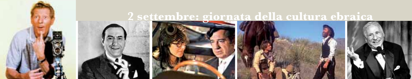
Da sinistra: Tony Curtis e Jack Lemmon; Danny Kaye; Ernst Lubitsch; Walter Matthau; Gene Wilder; Mel Brooks

2 settembre: giornata della cultura ebraica